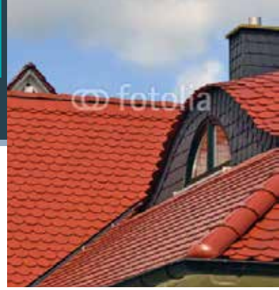
NOTRE GAMME DE COLORIS